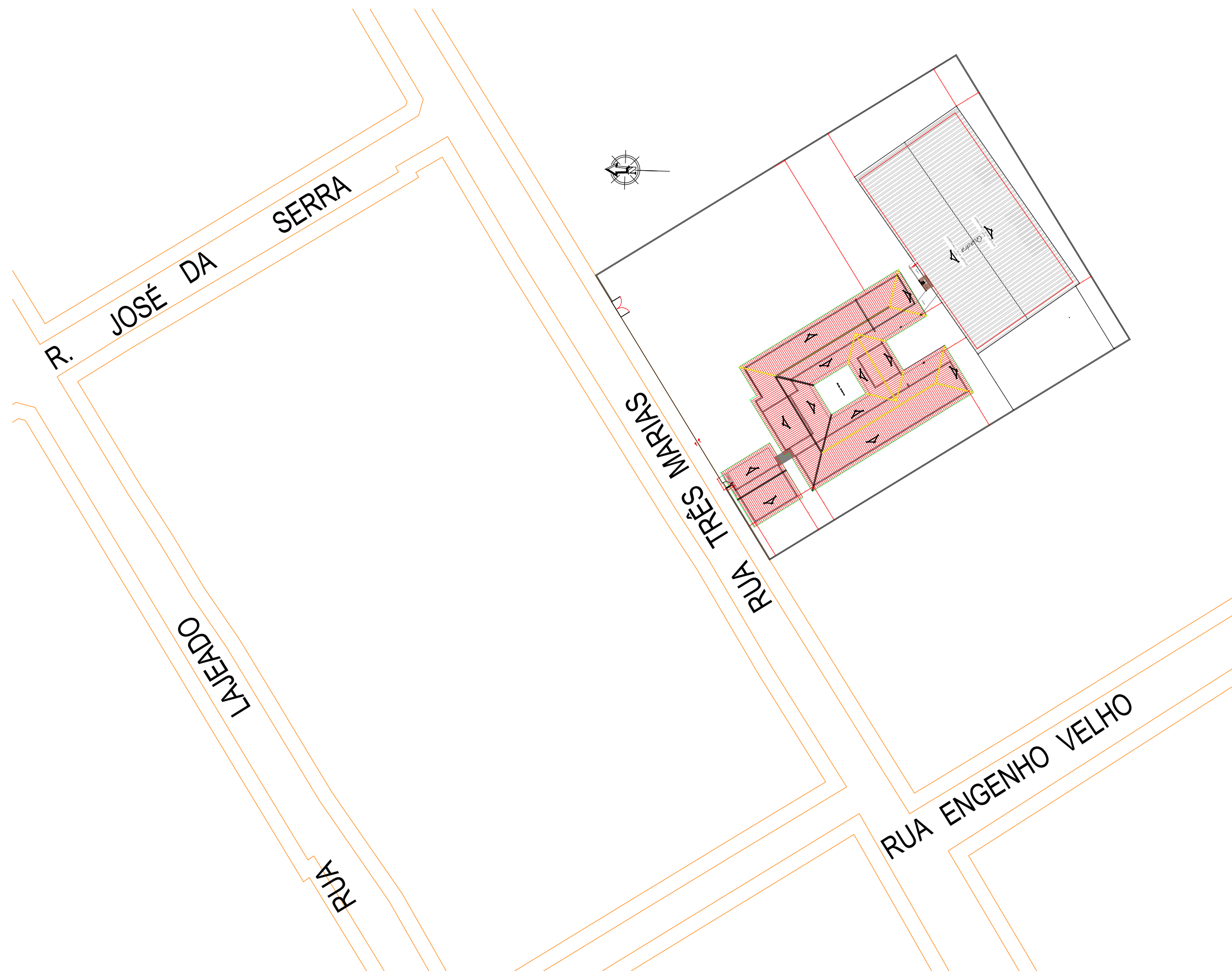
PLANTA DE LOCALIZAÇÃO ESC: 1/700

COORDENADAS GEOGRÁFICAS: 115°40'46.5"S 56°09'26.3"W